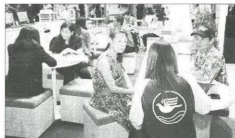
ผู้เข้าชมงานให้ความสนใจทำประกันภัยอย่างต่อเนื่องตลอดทั้งวัน