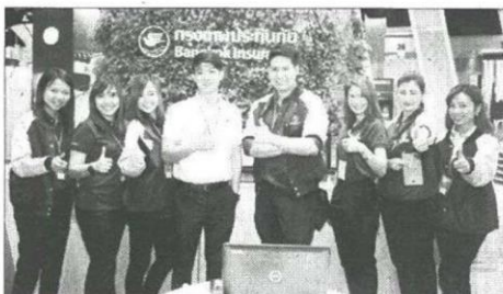
ทีมงาน BKI พร้อมให้บริการ

กรุงเทพประกันภัย ประสบความสำเร็จในการร่วมออกบูธงาน Money Expo 2016 ด้วยโปรโมชั่นเบี้ยประกันภัยสุดพิเศษและกิจกรรมสนุกๆ มากมาย ณ อาคารชาเลนเจอร์ อิมแพค เมืองทองธานี เมื่อวันที่ 12-15 พฤษภาคม 2559