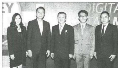
ผู้บริหารกรุงเทพประกันภัยร่วมในพิธีเปิดงาน Money Expo 2016

ส่วนบุคคล ประกันภัยอุบัติเหตุเดินทาง และประกันภัยสุขภาพ ด้วยเบี้ยประกันภัยราคาเบาๆ พร้อมของสมนาคุณกระเป๋าอเนกประสงค์ดีไซน์สุดเก๋ และตุ๊กตาหมีน่ารักๆ จาก BKI มามอบให้กับลูกค้าเฉพาะในงาน และกิจกรรมให้ผู้เข้าชมงานได้ร่วมเล่นเกมลุ้นรับของรางวัลมากมาย โดยตลอด 4 วันของการจัดงาน มีประชาชนสนใจเข้าเยี่ยมชมบูธซื้อประกันภัยและร่วมกิจกรรมต่างๆ กับกรุงเทพประกันภัยอย่างคึกคัก