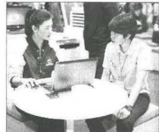
บริการให้คำปรึกษาด้านประกันภัย

ส่วนบุคคล ประกันภัยอุบัติเหตุเดินทาง และประกันภัยสุขภาพ ด้วยเบี้ยประกันภัยราคาเบาๆ พร้อมของสมนาคุณกระเป๋าอเนกประสงค์ดีไซน์สุดเก๋ และตุ๊กตาหมีน่ารักๆ จาก BKI มามอบให้กับลูกค้าเฉพาะในงาน และกิจกรรมให้ผู้เข้าชมงานได้ร่วมเล่นเกมลุ้นรับของรางวัลมากมาย โดยตลอด 4 วันของการจัดงาน มีประชาชนสนใจเข้าเยี่ยมชมบูธซื้อประกันภัยและร่วมกิจกรรมต่างๆ กับกรุงเทพประกันภัยอย่างคึกคัก